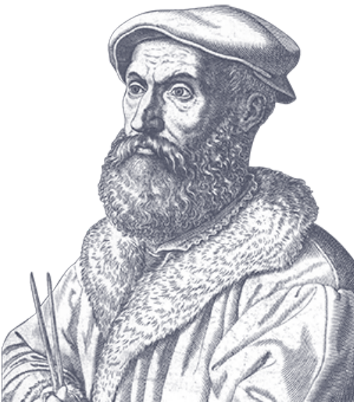
Niccolò Fontana Tartaglia

2차 방정식의 해법은 4천년 전 고대 바빌로니아 시대에 이미 알려져 있었지만, 3차 방정식의 해법은 16세기 초에 이르러서야 이탈리아 볼로냐의 수학자 델 페로(Scipione del Ferro)가 발견하였다고 전해진다. 1535년 이탈리아 브레샤의 말 더듬이 타르탈리아(Niccolò Fontana Tartaglia)라는 사람도 독립적으로 3차 방정식의 해법을 찾았고, 델 페로의 제자 피오르(Antonio Maria Del Fiore)와 타르탈리아는 공개 문제 풀기 대결을 하였다. 여기서 타르탈리아는 피오르가 낸 3차 방정식 문제 30개를 모두 풀었으나 피오르는 타르탈리아가 낸 문제를 하나도 못 풀었다고 전해진다.