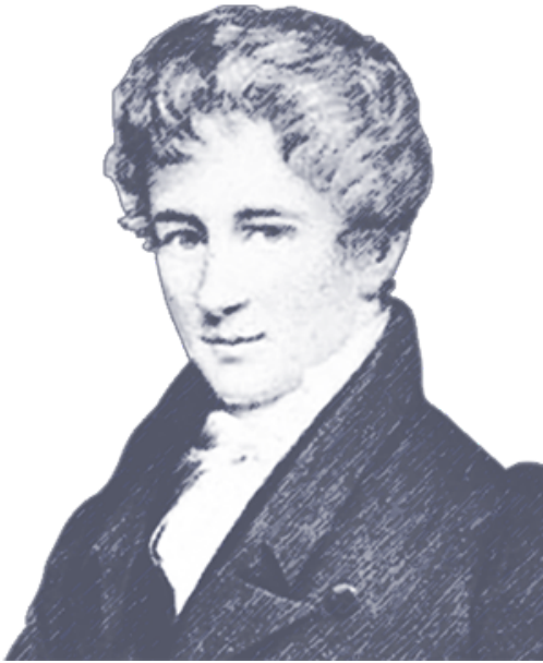
Niels Henrik Abel