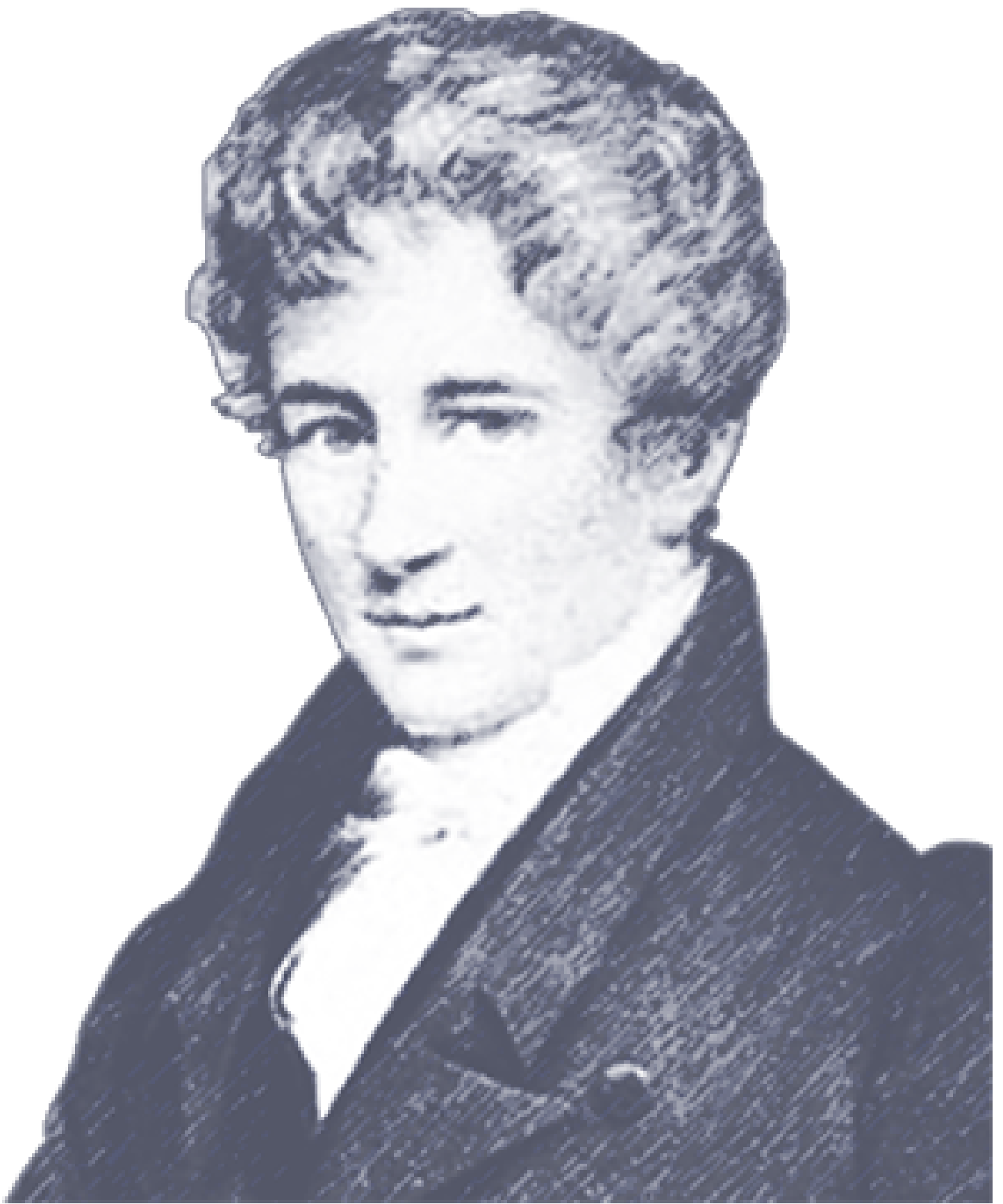
Niels Henrik Abel