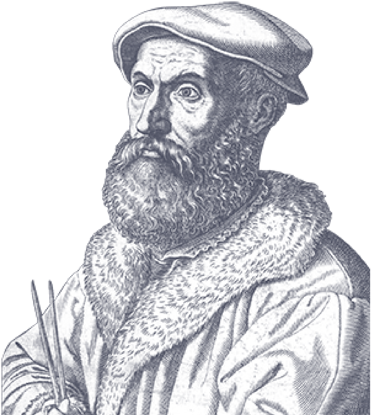
Niccolò Fontana Tartaglia

이 소문이 퍼지자 밀라노의 유명한 의사인 카르다노가 타르탈리아를 설득하여 3차 방정식의 해법을 전수받았다. 카르다노는 이 해법을 발표하지 않기로 타르탈리아와 약속을 했었으나 그 약속을 깨고 해법을 발표하였다. 타르탈리아는 매우 화가 났지만 이미 옆질러진 물이라 이 해법은 카르다노의 풀이로 알려지게 되었다. 카르다노의 제자였던 페라리는 곧 이어서 4차 방정식의 해법도 찾아내었다.