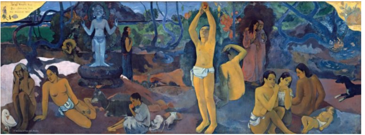
고갱, <우리는 어디서 왔는가? 우리는 누구인가? 우리는 어디로 갈 것인가?>, 1897

인간을 비롯해 이 세상에 존재하는 모든 것은 나름대로의 기원을 가지고 있다. 과거에 서로 다른 지역들에서는 다양한 신화나 전설을 통해 우주와 세상, 생명, 그리고 인간의 기원과 탄생을 설명했다. 예를 들어, 우리에게 친숙한 그리스 신화에서는 혼돈의 연못인 카오스가 가장 먼저 등장하면서 이후 여러 명의 신이 탄생했다고 설명한다. 중국의 반고 신화에서도 모든 것이 뒤섞인 혼돈 속에서 알에서 깨어난 거인이 하늘과 땅을 비롯한 나머지 세계를 창조했다고 이야기하고 있다. 최초로 농경이 시작되고 도시가 형성되었던 비옥한 초승달 지역에서는 신의 피로 인간을 만들어 신에게 봉사하도록 했다는 신화가 전해온다. 남아프리카에서는 땅의 구멍에서 인간이 등장했다는 이야기가 전해오고, 불가리아에서는 신과 악마가 흙으로 인간을 만들었다는 신화가 존재한다. 하지만 인간과 주변의 모든 것들이 어떻게 탄생했고 시작되었는지 이해하고, 설명하려는 다양한 노력이 아주 오래 전부터 존재했다는 것은 분명한 사실이다.