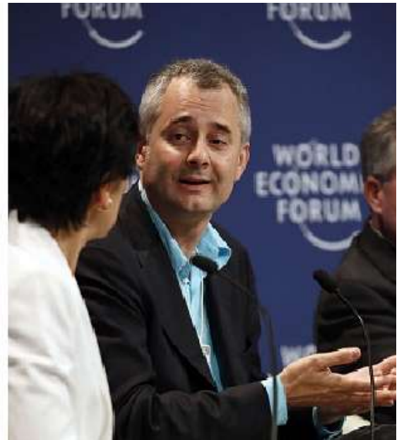
그림 4-2 우 바라바시Albert-László Barabási