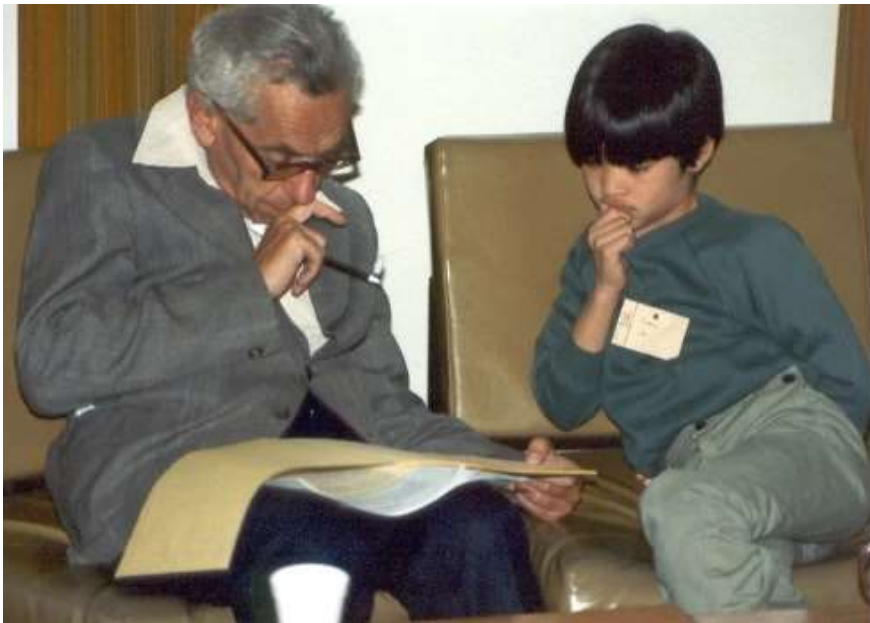
그림 4-1 좌 에르되시Paul Erdős

올해 초 3월 미국에서 열린 미국물리학회APS March Meeting에서는 “네트워크 과학 20년: 구조에서 조절까지Twenty Years of Networks Science: From Structure to Control”라는 제목의 기초강연이 있었다. 강연자는 물론 복잡계 네트워크 이론의 선구자라 할 수 있는 바라바시Albert-László Barabási, 1967~였다. 최근의 네트워크 이론은 학문적 성숙기에 접어들어 다양한 분야에 응용되고 있다. 우리는 이제 소셜 미디어에서 가짜 뉴스의 확산이 우리 사회에서 전염병이 전파되는 것과 같고, 새로운 혁신적 아이디어의 전파와도 양상이 같다는 것을 알고 있다. 우리는 퍼콜레이션 이론을 이용하여 가짜뉴스와 질병의 확산을 억제하고, 새로운 아이디어의 확산은 더욱 활발히 퍼지도록 조절할 수 있다. 헤머슬리와 브로드벤트가 60년 전에 도입한 수학 이론이, 사회 연결망과 인터넷 연결 구조에 관한 실증적 데이터 연구로부터 시작된 지 이제 20년이 된 네트워크 과학[7]을 만나 새로운 지식을 생산한다.