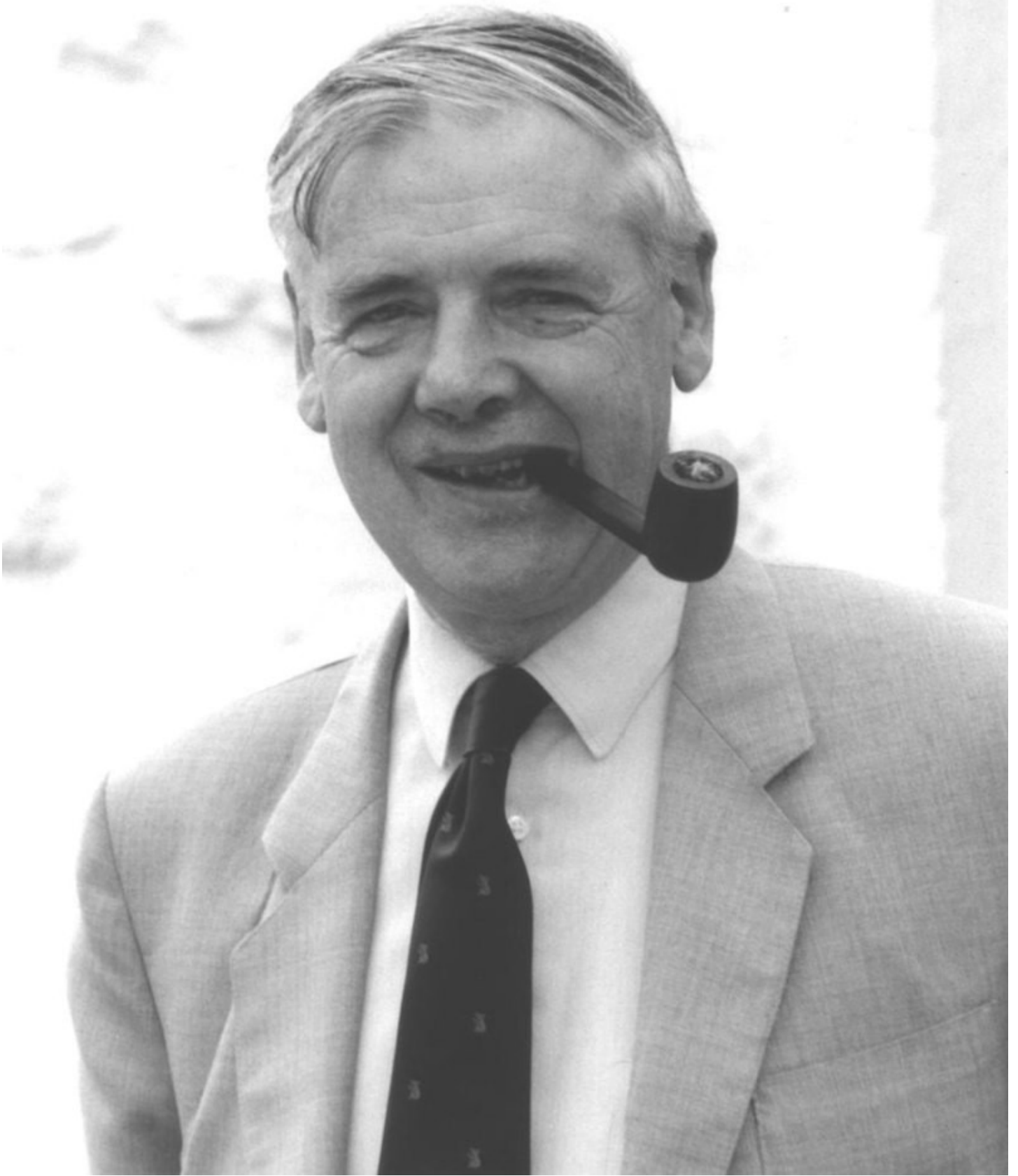
그림2 해머슬리 John Michael Hammersley