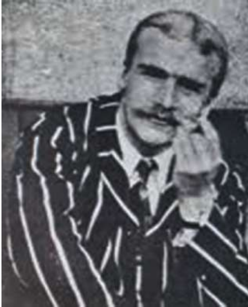
그림 1 존 버든 샌더스 홀데인

어디에나 있지만 느끼지 못하는 공기처럼, 사실 우리는 일상적으로 타인과의 신뢰와 협동 속에서 살아간다. 물론 매체를 통해 접하는 세상사의 전형은 무너진 신뢰에 관한 아름답지 못한 이야기들이고, 인류의 역사는 말세를 향하여 꾸준히 악화가 양화를 구축해 가는 과정인 듯 보이기도 한다. 그렇지만 생사의 문턱이 될 수도 있는 왕복 2차로의 밤길을 재촉해 달리면서도, 맞은편에서 다가오는 불빛을 대부분의 사람들이 무감하게 넘기며 사는 일상은 어떻게 해석해야 할까?